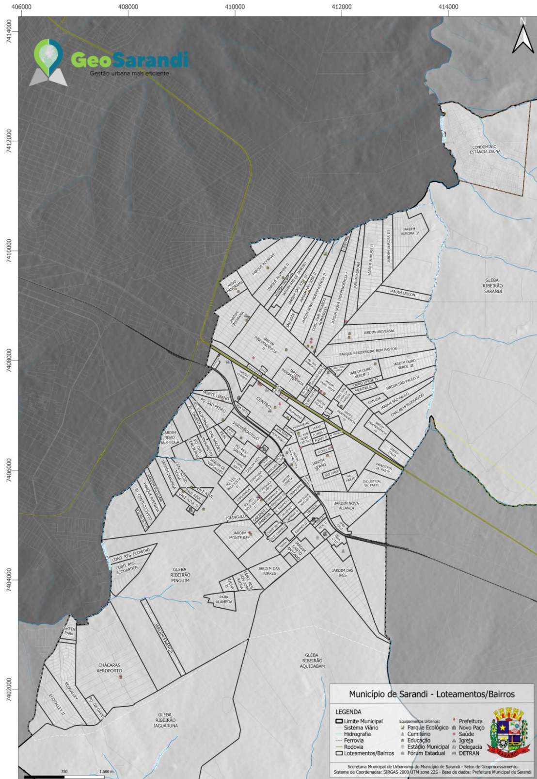
Figura 1: Mapa da cidade de Sarandi-PR.