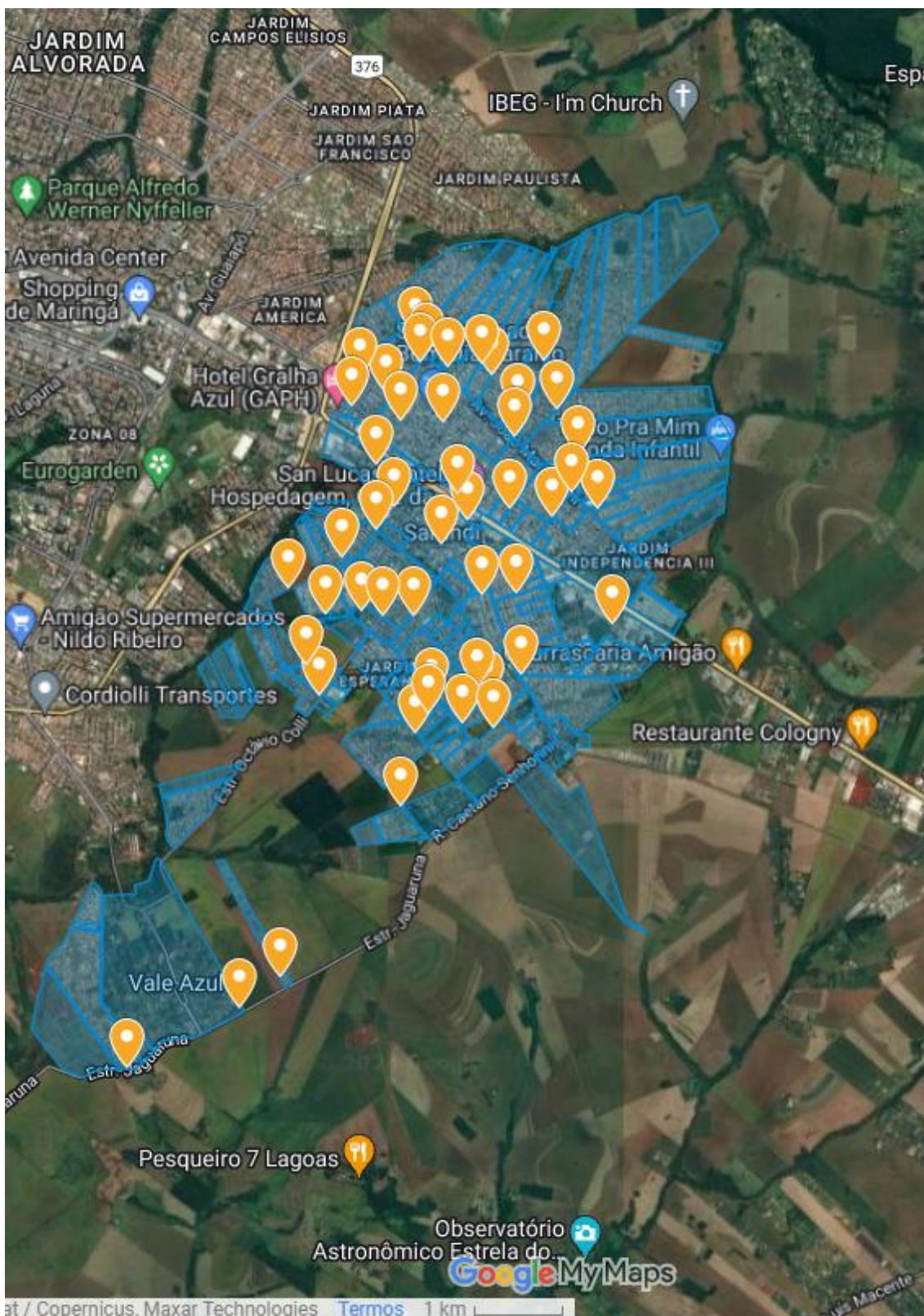
Figura 3: Mapa da cidade de Sarandi-PR. Distribuição de UTAs.